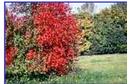
Odrzański plener fotograficzny