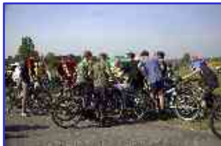
Dzień bez samochodu