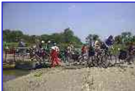
Międzynarodowy Rajd Rowerowy Szlakiem Odry