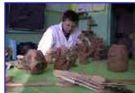
Plener artystyczny w Wietszycach