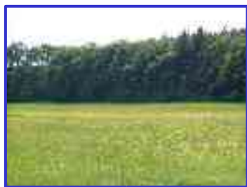
Lasek św. Jadwigi w Lubiążu, odtworzenie 6 kapliczek