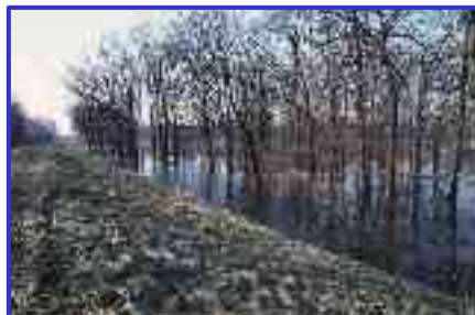
Lasy Łęgowe w międzywalu