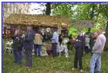
Korso kwiatowe w Lubiążu