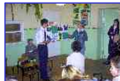
Młodzieżowy projekt „W poszukiwaniu dziedzictwa kulturowego Szlaku Odry”