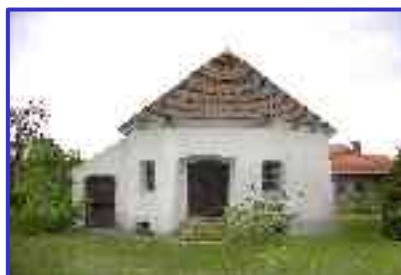
Minimuzeum w Chobieni