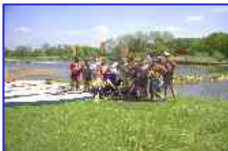
Spływ kajakowy Szlakiem Odry