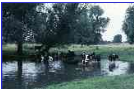
Przyjazny przyrodzie wypas bydła