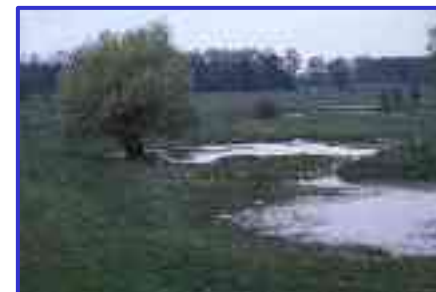
Mnogość niewielkich oczek wodnych