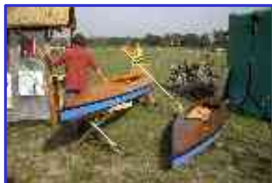
Budowa kajaków w Pęcławiu